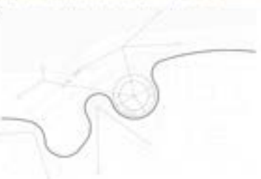
CONCEPTO VISUAL URBANO

El lema de un pabellón circular nace de un concepto morfológico desde la mejor figura que representa la belleza es el "círculo". Partiendo de este concepto, se propone una alternativa geométrica que logra marcar superficie dentro del terreno y que alberga actividades diversas, tanto de espacios culturales, como semi culturales y al aire libre. Es por este motivo que se realizan una serie de configuraciones a la figura morfología inicial; pero a partir de ello lograr espacios que se adecúan a estas características. La figura circular nace en gran medida desde el cual convergen todos los ejes de los espacios culturales y semi-culturales, y al mismo tiempo la distribución de las propuestas funcionales en torno al mismo permite mantener visualidad hacia el río sin la obstrucción de un objeto volumétrico. La diferencia de altura entre la zona y el pabellón incorpora un recurso natural, como ser el agua, el cual brinda el espacio donde se desarrollan las actividades y de él usarla la sensación de estar rodeado de un elemento natural propio del lugar, permitiendo a su vez una corriente de aire fresca. La configuración topográfica del grado con sus declives, fue uno de los puntos que guían el desarrollo de la propuesta del parque en la cual se logra una continuidad de circulaciones y visiones entre los sectores de la zona urbana y la avenida costera; como actualmente lo ejemplar hay en ella los vecinos y miembros de la comunidad.