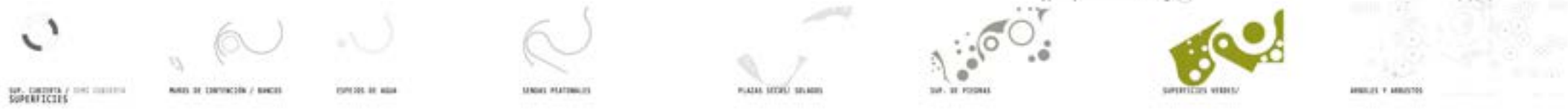
SUP. COBERTA / LINEA COBERTA SUPERFICIES MARGEN DE CONTINENCIA / BANCOS ESPACIO DE AGUA LINEAS PLANTONALES PLAZAS SUELA / SOLADOS SUP. DE PISOS SUPERFICIES VERDES ANILLOS Y ARBUSTOS