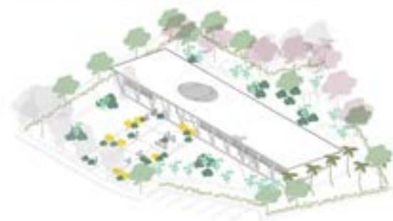
ZONA DE MAY CALOR HORARIO